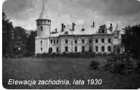
Elewacja zachodnia, lata 1930