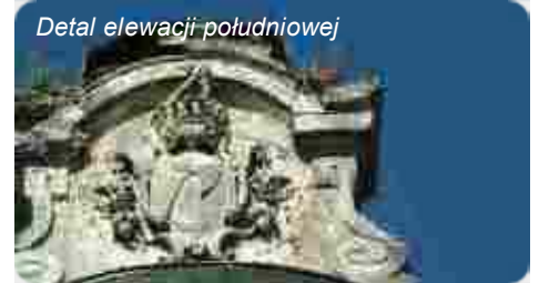
Detal elewacji południowej