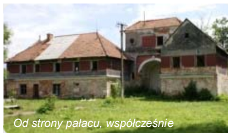
Od strony pałacu, współcześnie