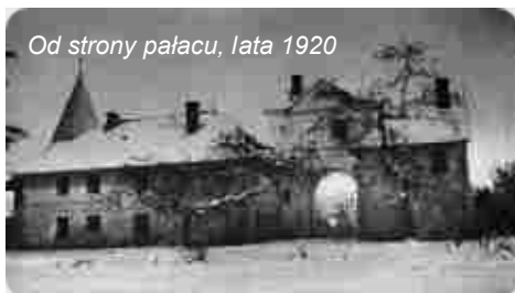
Od strony pałacu, lata 1920