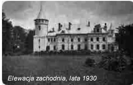
Elewacja zachodnia, lata 1930