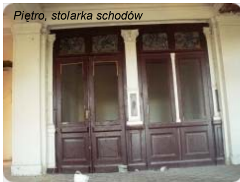
Piętro, stolarka schodów