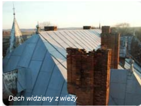
Dach widziany z wieży