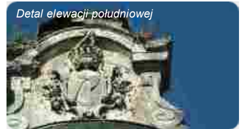
Detal elewacji południowej