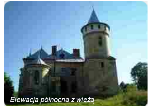
Elewacja północna z wieżą