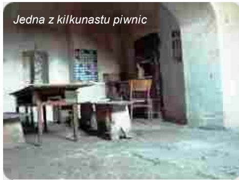
Jedna z kilkunastu piwnic