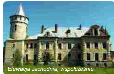
Elewacja zachodnia, współcześnie