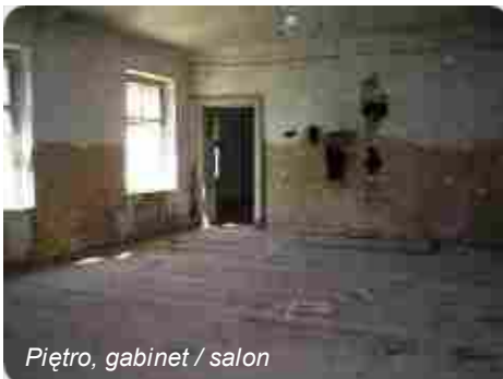
Piętro, gabinet / salon

Dwie kondygnacje naziemne, obszerne piwnice i potężny strych: łącznie blisko 3000 m 2 powierzchni użytkowej