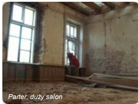
Parter, duży salon