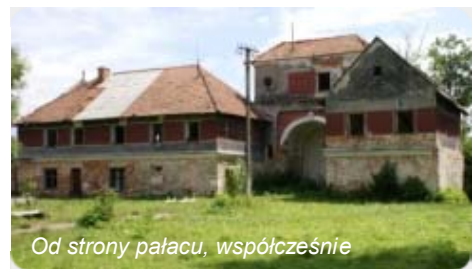
Od strony pałacu, współcześnie