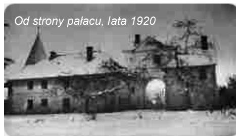
Od strony pałacu, lata 1920