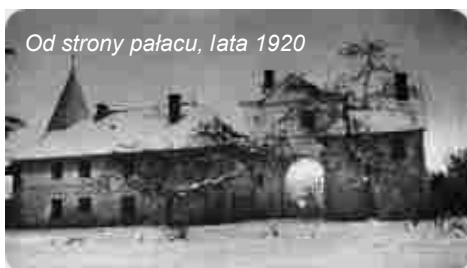
Od strony pałacu, lata 1920