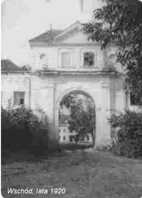
Wschód, lata 1920

Naprzeciw Pałacu znajduje się starszy budynek wjazdowy, zwany „Bramką”: około 1000 m 2 do zagospodarowania. Mimo późniejszych przebudowań nosi piętno baroku, był zapowiedzią niezrealizowanego zamierzenia rezydencjonalnego Jabłonowskich