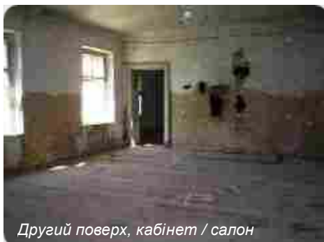
Другий поверх, кабінет / салон

Два поверхи, просторі підвали та імпазантні мансарди складають близько 3000 м2 корисної площі