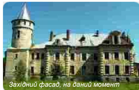
Західний фасад, на даний момент