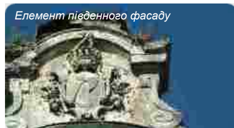
Елемент південного фасаду