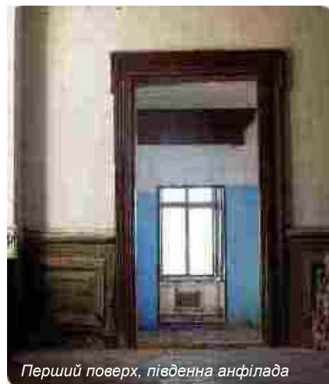
Перший поверх, південна анфілада