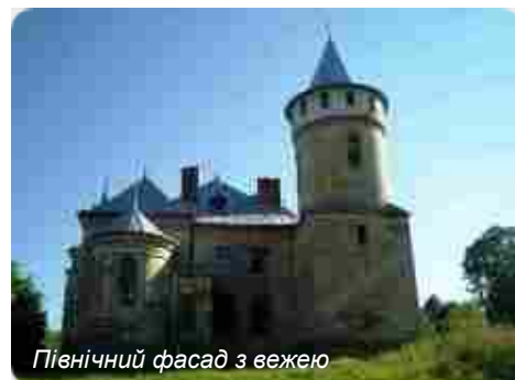
Північний фасад з вежею