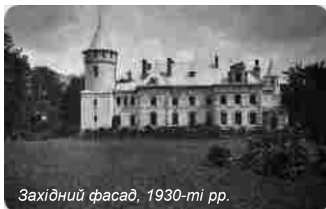
Західний фасад, 1930-ті рр.