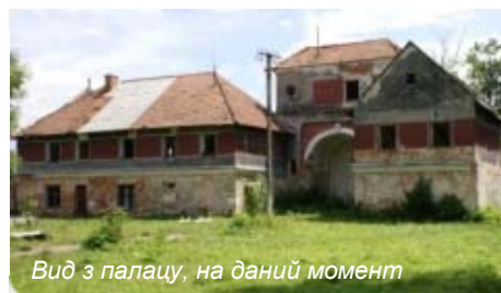
Вид з палацу, на даний момент