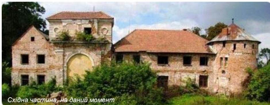
Східна частина, на даний момент