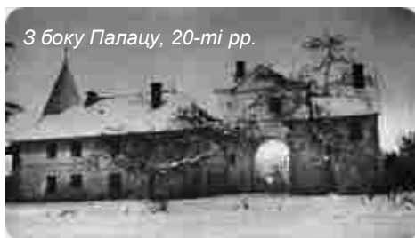
З боку Палацу, 20-ті рр.